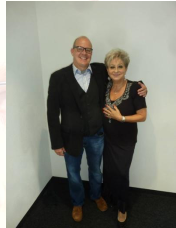
Kaffeeklatsch im Clubhaus Ludwigsfelde am 03.09.2014