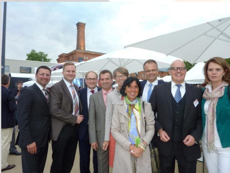
Sommerfest der Landesregierung in Potsdam am 02.07.2014