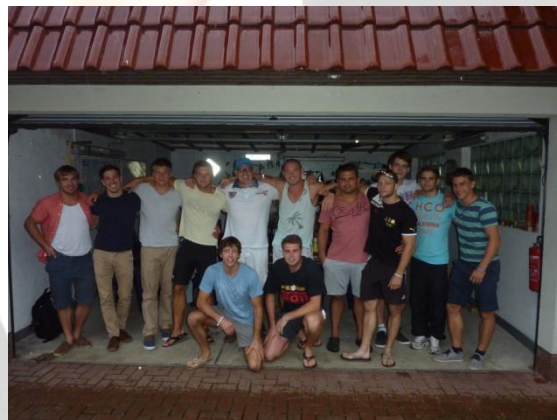
Saisonöffnung des 1. LSC Luckenwalde am 29.08.2014 / „Präsidentengrillen“ mit den Frankfurter Ringern am 23.07.2014