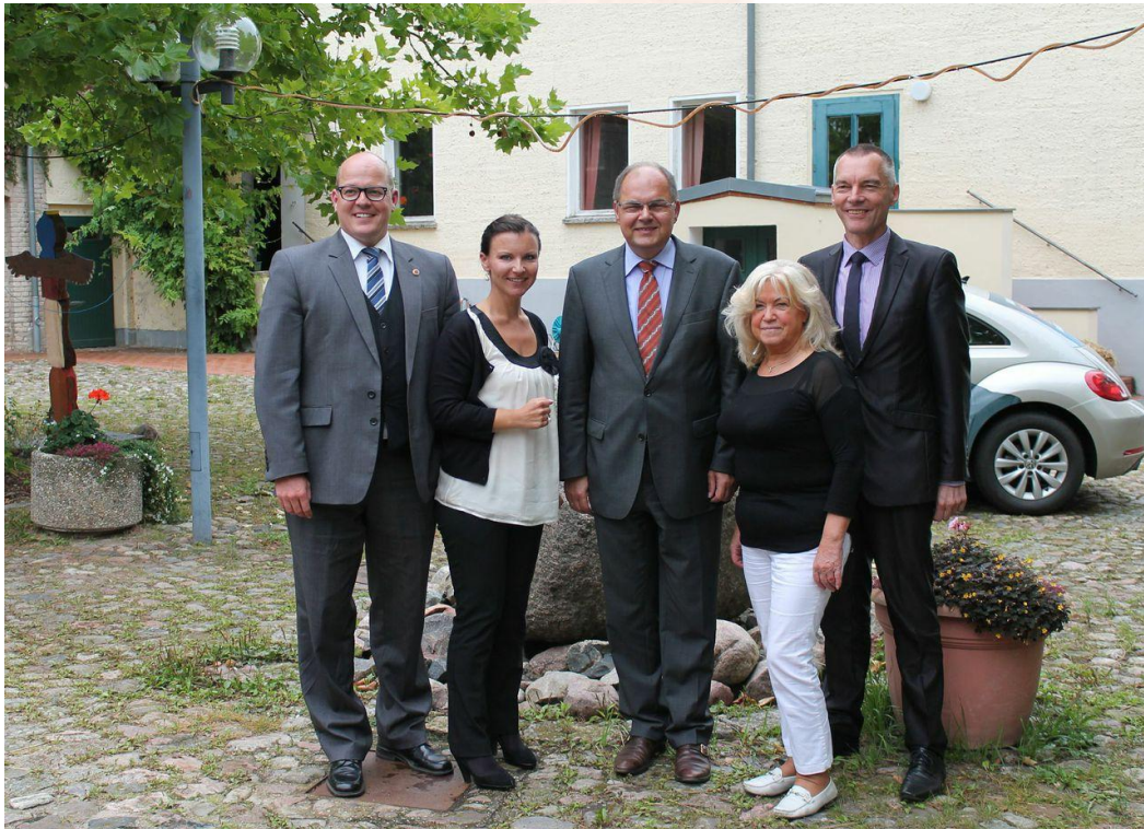
Besuch von Landwirtschaftsminister Christian Schmidt (CSU) in Teltow-Fläming am 31.08.2014