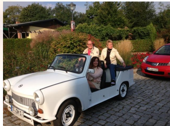
Oldtimerrally in Ludwigsfelde am 06.09.2014