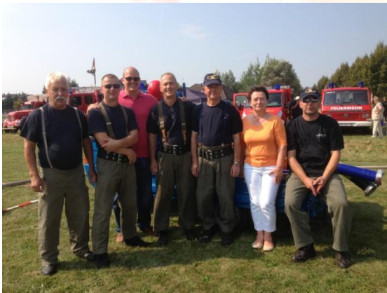
2014 Dorffest und 80 Jahre Feuerwehr in Ahrensdorf am 06.09.2014