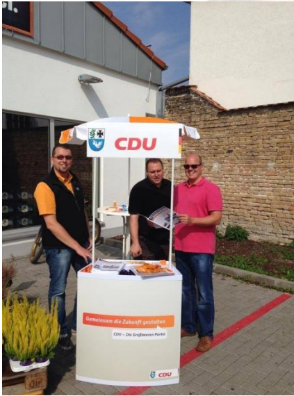
Infostand in Großbeeren am 06.09.2014