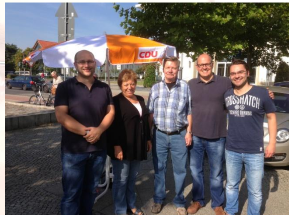
Infostand in Ludwigsfelde am 05.09.2014