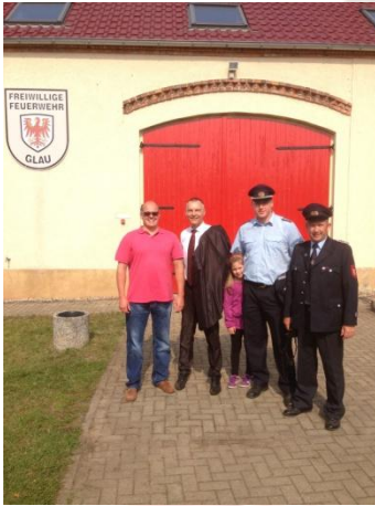
Dorffest und 80 Jahre Feuerwehr in Glau am 06.09.2014