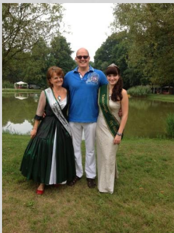
Fischerfest in Mellensee am 27.07.2014