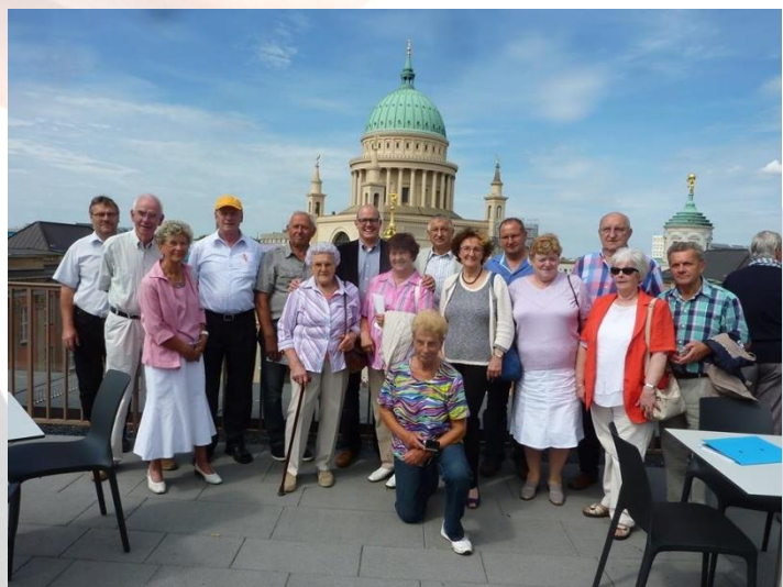
Besuchergruppe aus Zossen und Jüterbog im Landtag am 03.07.2014

Quelle: Märkische Allgemeine Zeitung, 26.06.2014