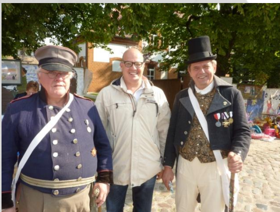
Siegesfest in Großbeeren am 23.08.2014