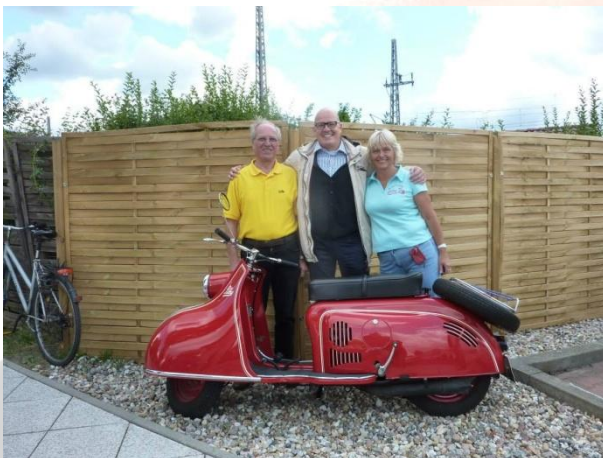
Internationales Rollertreffen Ludwigsfelde am 24.08.2014

Quelle: Pressemitteilung, 19. August 2014