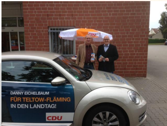
Für Sie unterwegs – in Sperenberg und Trebbin am 03.09.2014