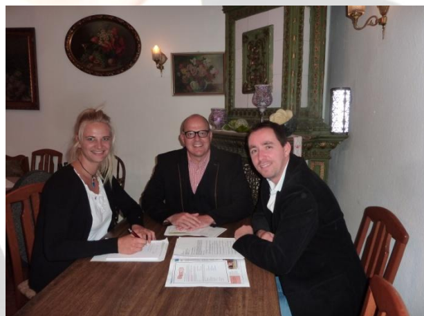
Arbeitsgespräch mit dem Ortsbeirat von Gröben am 18.08.2014