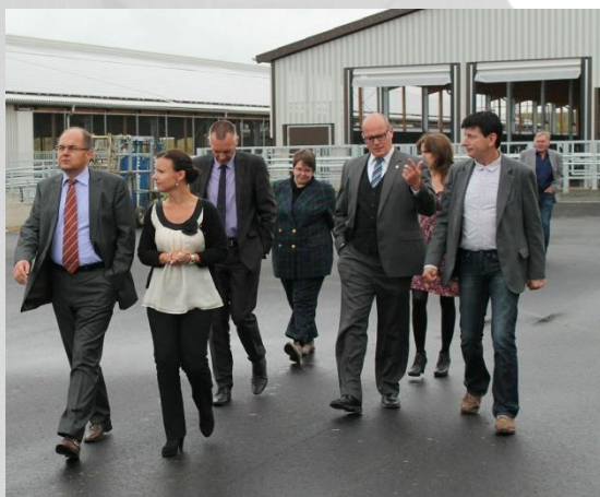
Besuch der Agrar Genossenschaft Trebbin mit Bundeslandwirtschaftsminister Christian Schmidt (CSU) am 31.08.2014