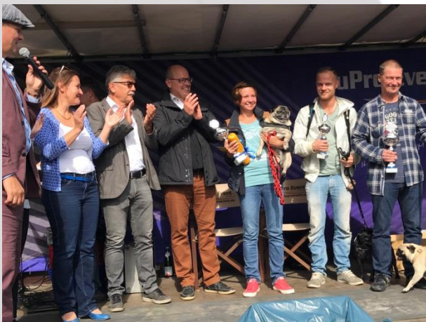
03.09.2017 Mopsrennen in Ludwigsfelde