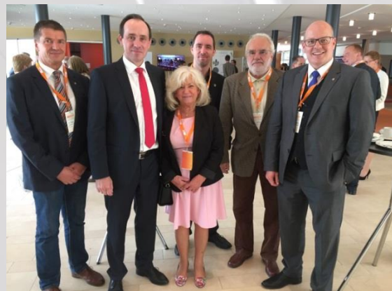
15.07.2017 CDU-Landesparteitag in Schönefeld