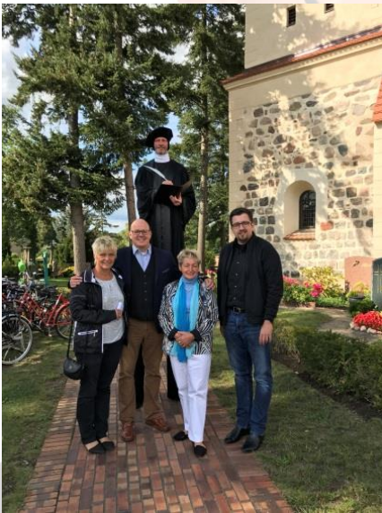
10.09.2017 Veranstaltung „Luther mal anders“ in der Dorfkirche Siethen