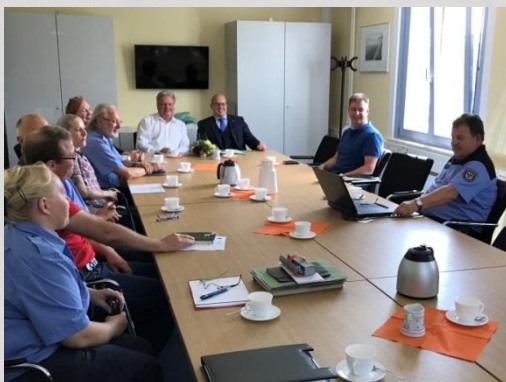
28.07.2017 Arbeitsgespräch mit Mitarbeitern der Justizvollzugsanstalt Neuruppin-Wulkow