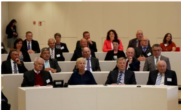
06.09.2017 Festveranstaltung zum 80.Geburtstag unseres Brandenburger CDU-Ehrenvorsitzenden Jörg Schönbohm in Potsdam