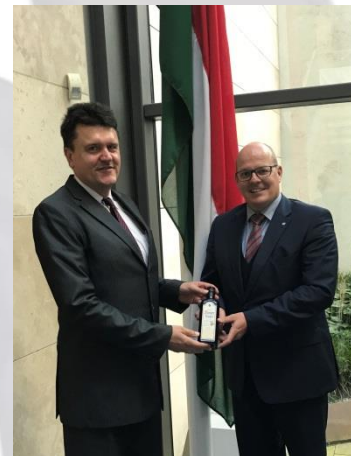
28.08.2017 Besuch der Botschaft der Republik Ungarn in Berlin