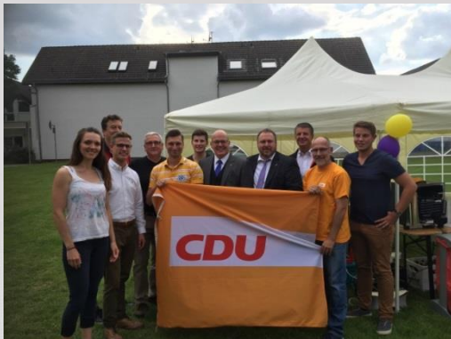
15.07.2017 Sommerfest der CDU und JU Großbeeren in Kleinbeeren

Quelle: Märkische Allgemeine Zeitung, 20.07.2017