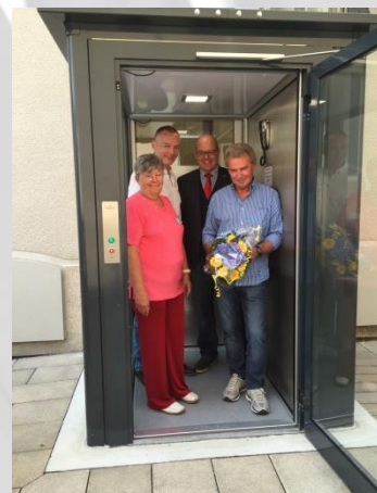
11.07.2017 Einweihung des neuen Fahrstuhles am Rathaus Trebbin