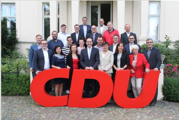
17.07.2017 Konstituierende Sitzung des CDU-Landesvorstandes Brandenburg in Potsdam