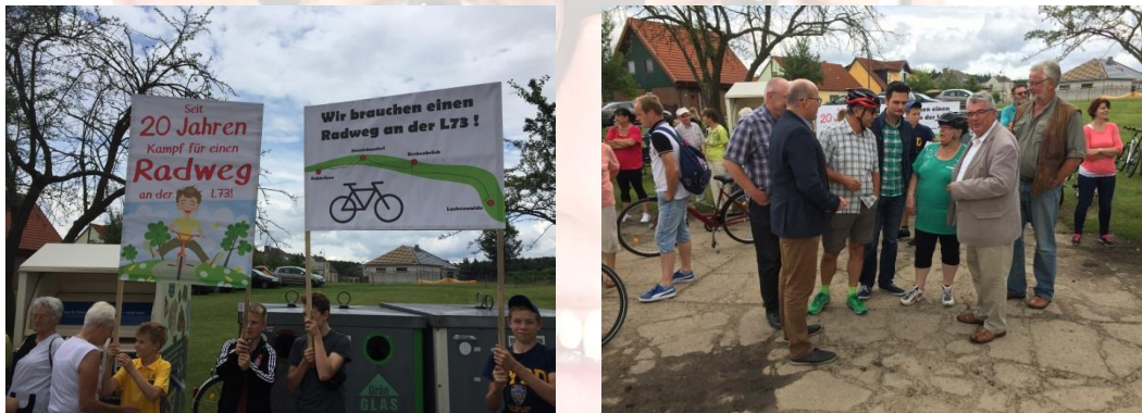
23.07.2017 RBB-Robur in Tour in Berkenbrück (Nuthe-Urstromtal)