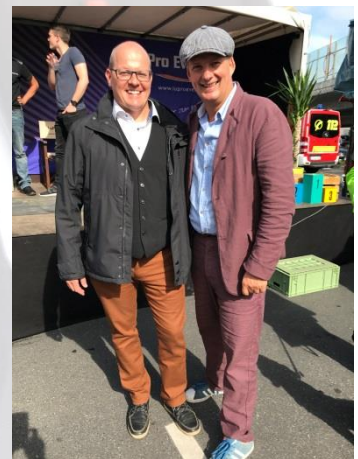
26.08.2017 Beim Kreiserntefest in Ruhlsdorf