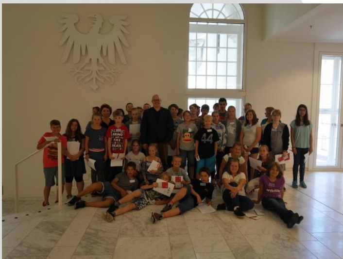
04.07.2017 Besuch der Grundschule Blankensee im Landtag